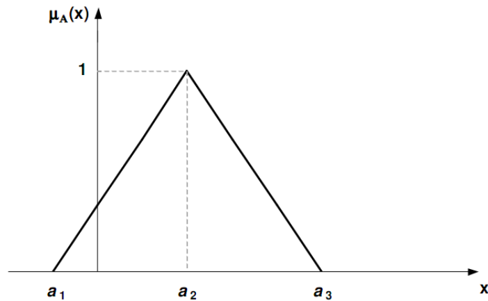
Figura 1 - Ilustração gráfica do número fuzzy A = (a_1, a_2, a_3) .