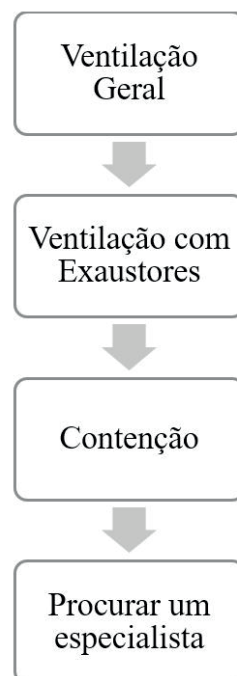
Figura 4 – Hierarquia tradicional de práticas para controle de exposição utilizada na técnica control banding .

Uma técnica que vem sendo amplamente utilizada na avaliação de risco à exposição aos nanomateriais é a de controle por faixas ( control banding ) [7], uma proposta de sistema de gestão e de estratégia de prevenção que auxilia gestores de pequenas e médias empresas na realização da avaliação dos riscos de forma qualitativa, sem a exigência de grande capacitação dos gestores [41]. Essa metodologia fornece resultados de avaliação com uma qualidade razoável, sem o envolvimento de especialistas [7]. Essa técnica possui quatro faixas que podem ser visualizadas na Figura 4.