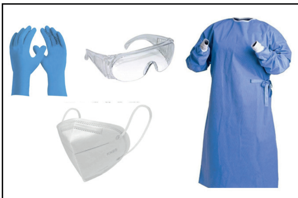
Figura 3 - Modelos de equipamentos de proteção individual indicados para manipular nanotubos de carbono.

Outra forma de minimizar a possibilidade de contaminação em laboratórios é utilizando EPI adequados. A Figura 3 demonstra alguns tipos de equipamentos que devem ser utilizados para manusear nanomateriais à base de carbono.