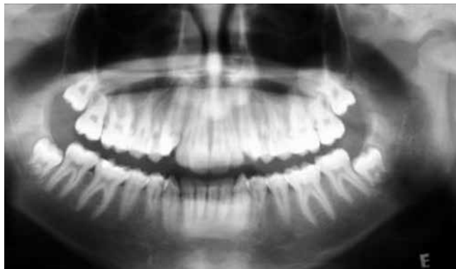
Figura 3 – Radiografia Panorâmica: imagem compatível com Pseudocisto antral ambos os lados