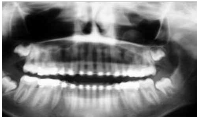
Figura 2 – Radiografia Panorâmica: imagem compatível com Pseudocisto antral lado esquerdo.