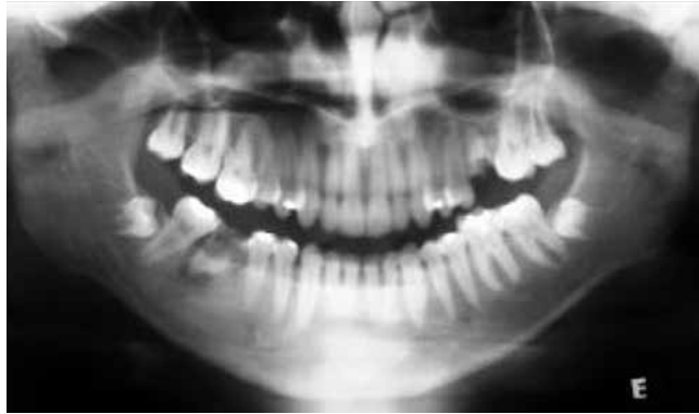
Figura 1 – Radiografia Panorâmica - imagem compatível com Pseudocisto antral lado direito.

RADIOCENTRO - Centro Odontológico de Documentação Ortodôntica localizado na cidade de Volta Redonda, Rio de Janeiro, foram analisadas em relação à presença de imagens radiográficas compatíveis com Pseudocisto Antral (figuras 1 a 3).