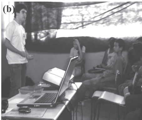
Figura 3 – Apresentação da equipe multidisciplinar em Canas/SP: (a) Visita ao Sítio Arqueológico Caninhas; (b) Seminário em escola pública.

A Figura 4 mostra a visita de alunos da rede pública de Canas, à Fundação Cultural de Jacarehy, onde foi realizado o Inventário das cerâmicas arqueológicas. Em (a) é mostrado o processo de higienização, em (b) a numeração e em (c) a reconstituição das cerâmicas arqueológicas de uma tigela cerimonial de porte pequeno e uma tigela de porte grande. Ambas as peças continham pinturas comum à tradição Tupiguarani – fundo branco, com faixas vermelhas e grafismos em linhas pretas.