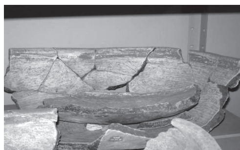
Figura 2 - Fragmentos de cerâmicas indígenas do sítio arqueológico Caninhas – Canas/SP

A experiência brasileira tem demonstrado que a preservação do patrimônio cultural dos sítios arqueológicos depende do envolvimento das comunidades locais, bem como da participação destas nos benefícios decorrentes de atividades econômicas como, por exemplo, o turismo, a criação de museus, comércio de cerâmicas artesanais, etc.