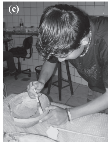
Figura 4 – Visita da equipe à Fundação Cultural de Jacarehy: (a) Higienização; (b) Numeração; (c) Reconstituição das cerâmicas arqueológicas.